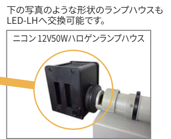
ニコン 12V50Wハロゲンランプハウス