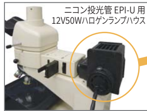
ニコン投光管 EPI-U用 12V50Wハロゲンランプハウス